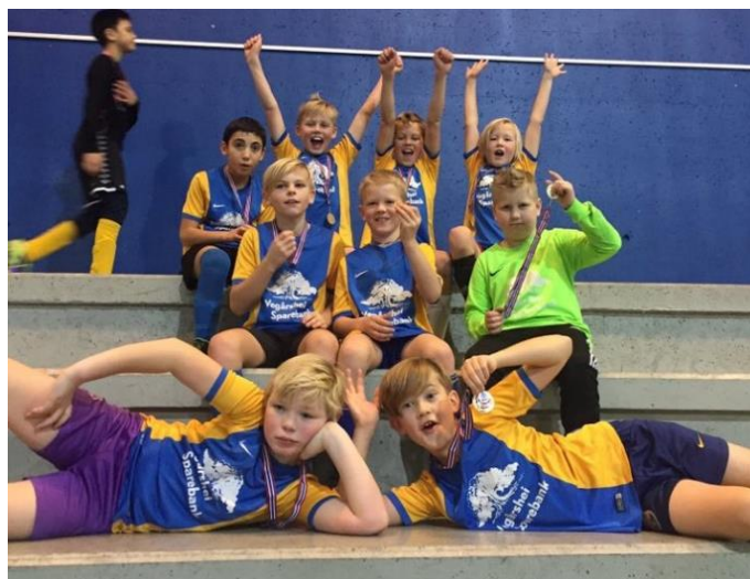
Bilde av en fornøyd gjeng G10 etter turnering i Kristiansand.