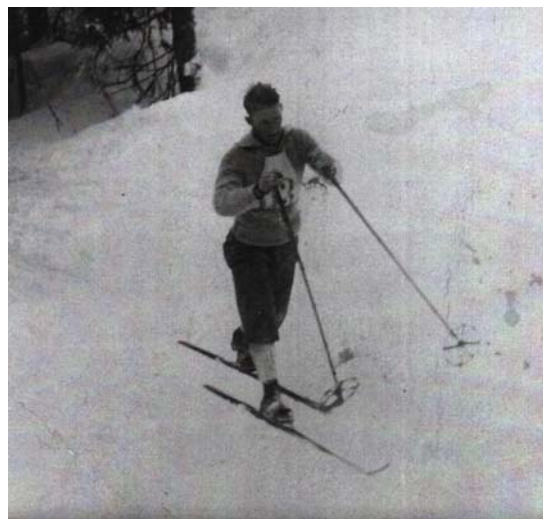
Olav Flaten, Holmenkollen 1928