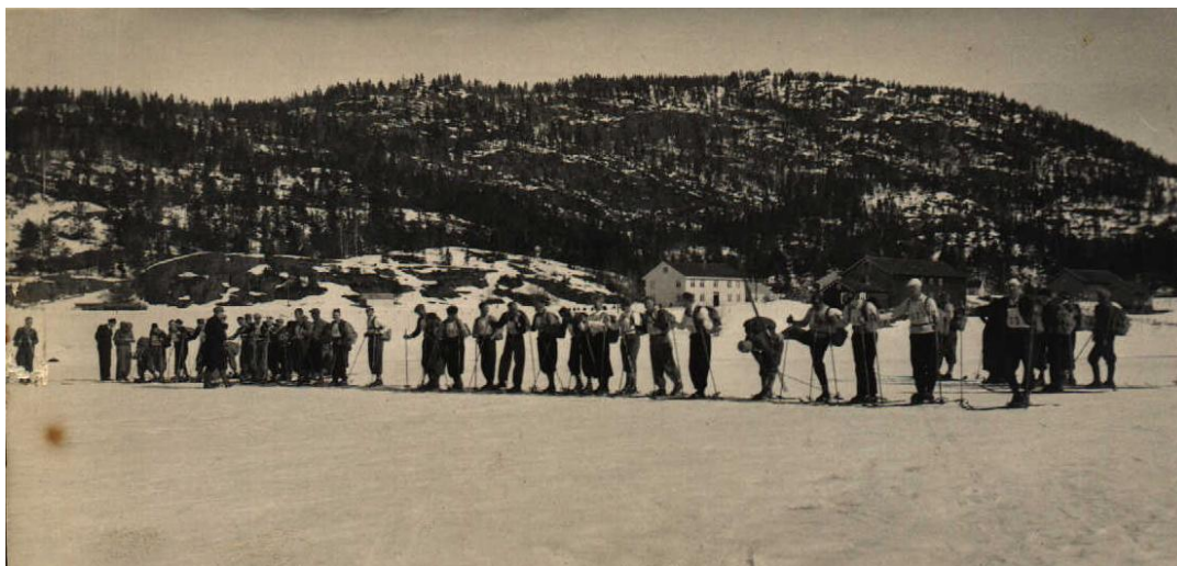
Fra det første Fjellmannsløpet, 5. april 1936, starten går på Mo